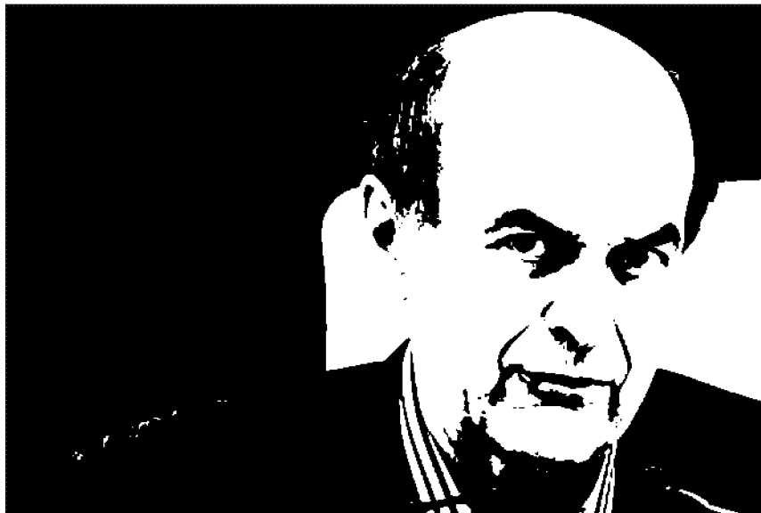
L'ex ministro del Pd, Pierluigi Bersani, sarà oggi nel Friuli Venezia Giulia